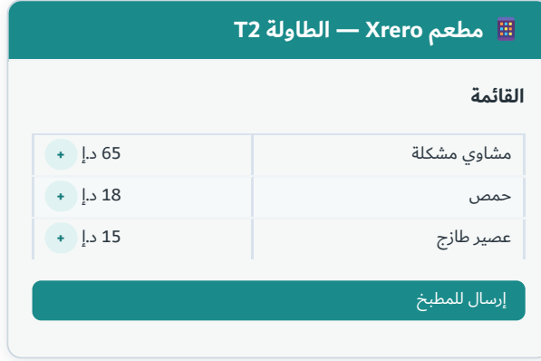
الشكل 25.1 — قائمة الطلب الذاتي QR للضيف: تذهب الطلبات مباشرةً للمطبخ وحساب الطاولة.

مع الطلب الذاتي ، يسمح الضيوف رمز QR على الطاولة (أو يستخدمون كشكاً) لتصفح القائمة والطلب من هواتفهم. تتدفق الطلبات مباشرةً إلى المطبخ وإلى حساب الطاولة، فتقلّ الطوابير ويتفرّغ التّذّل. وتختار أن يدفع الضيوف عبر الإنترنت أو على الصندوق.